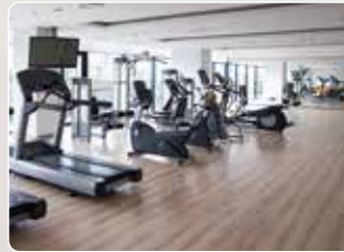
スポーツクラブ・レジャー施設