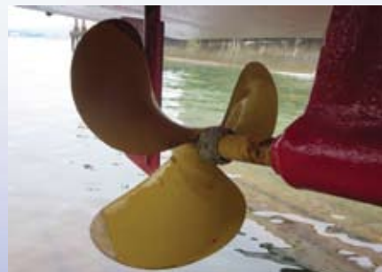
運送船／広島県 付着物無し、成績良好