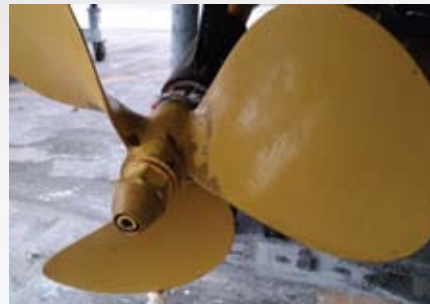
プレジャー艇／夢の島(約4ヶ月実績) プロペラ・シャフトとも付着物・汚損無し、成績良好