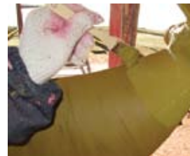
フィニッシュ塗装