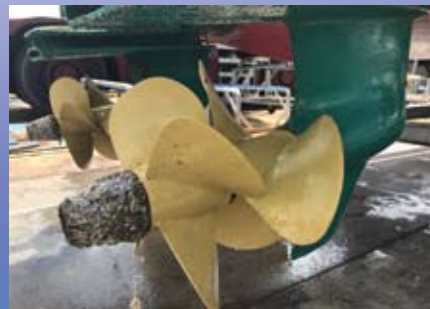
警備船／広島県(約6ヶ月実績) プロペラに付着物無し、成績良好