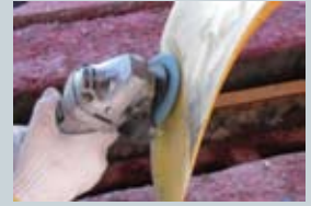
プロペラ表面の目粗し

羽根の先端は水流摩擦と遠心力で剥がれる恐れがあるため、マスキングして予め塗り残すことを推奨します。