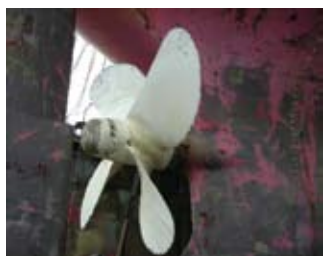
就航後 32 ヶ月 (バルクキャリア)