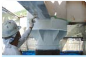
⑥ 中塗り (フローレックス中塗 EP MS)