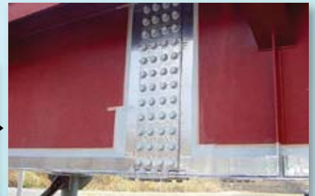
塗装後 5 年経過。 施工部に異常は見られません。