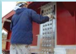
チタン箔の貼り付け 及び CMP チタンプライマー塗装