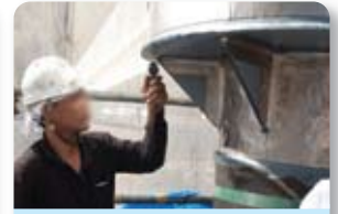
④ チタン箔シート貼付け