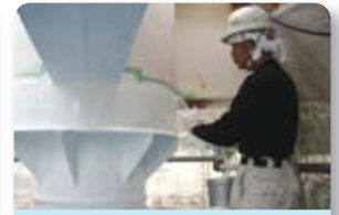
⑦ 上塗り (フローレックス上塗 MS)