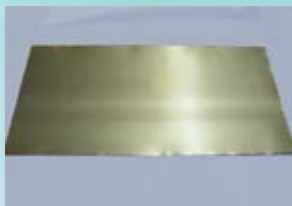
チタン箔シート (NTAC-Ti シート)