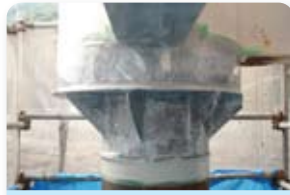
⑤ チタン箔専用プライマー塗装 (CMPチタンプライマー)