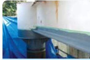
② 防食下地塗装 (エピコンジンク HB-2)